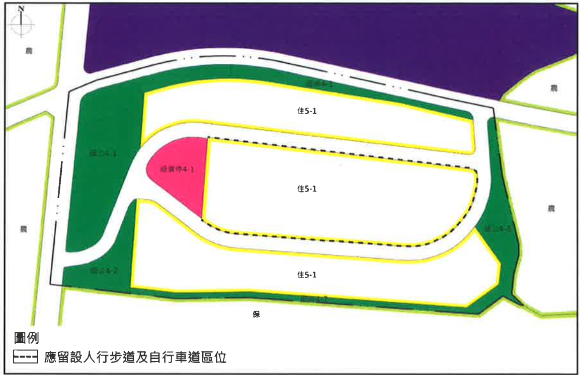
圖 6-7-1 通盤檢討後住宅區留設人行步道及自行車道區位示意圖